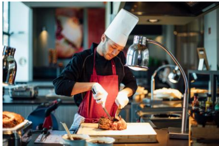
Für Leonardo Hotels Central Europe gehören duale Studenten ebenfalls zu den herausragenden Fachkräften von morgen ©Foto: Julia Nimke Foto-Download per Hyperlink oder hier .